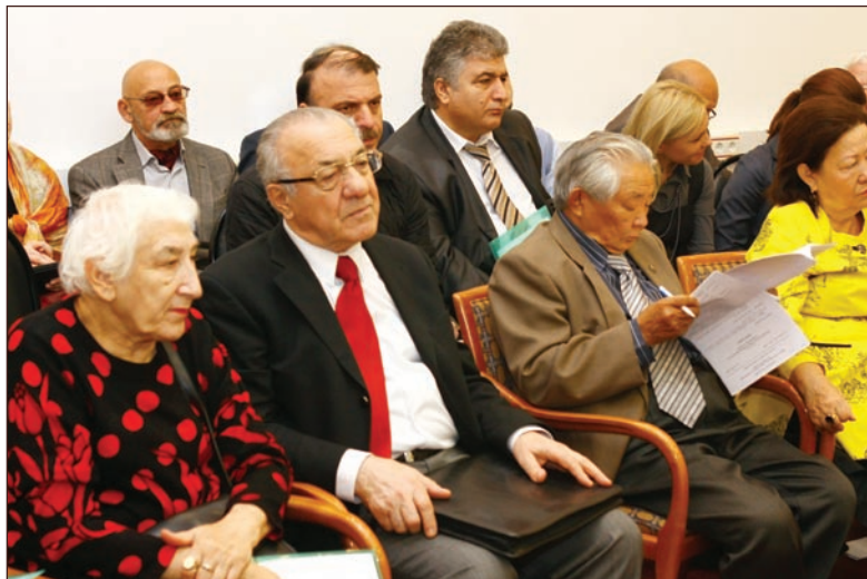
Участники круглого стола