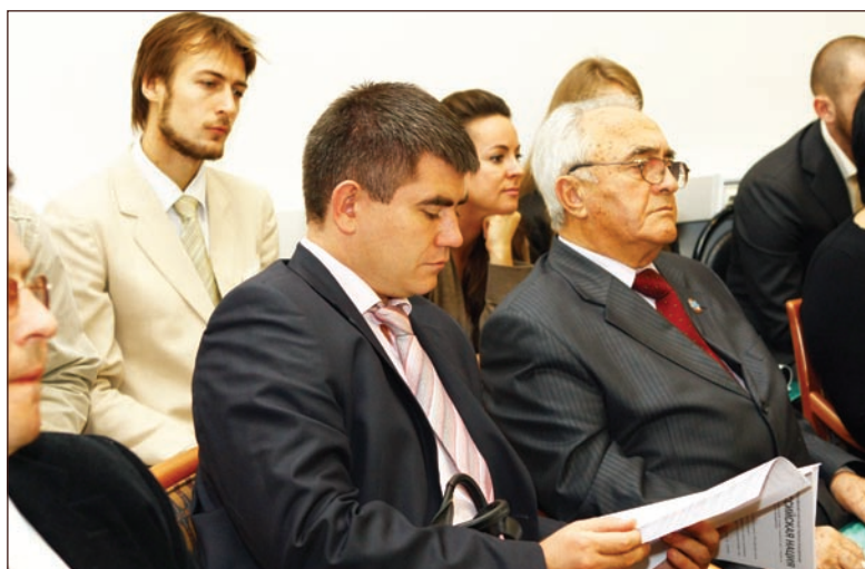
Участники круглого стола