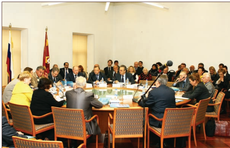
Заседание круглого стола «Российская нация и общественное развитие России в современных условиях»